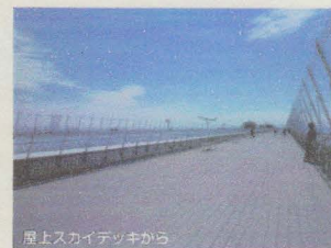
屋上スカイデッキから

名鉄の改札をでると広いエントランス。正面にアクセスプラザのブースがでんと構えています。アクセスプラザの案内所では空港内の案内・サービス情報を尋ねたり、車いす貸し出しの手続きをすることができます。また飛行機を利用の場合は、各交通機関のおりばからチェックインカウンターまでの介助対応が可能です。(事前にテレフォンセンターへの連絡が必要)