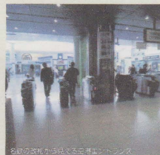
名鉄の改札から見える空港エントランス