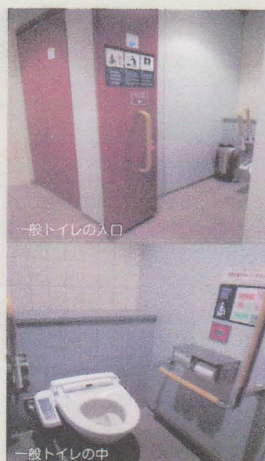
一般トイレの入口