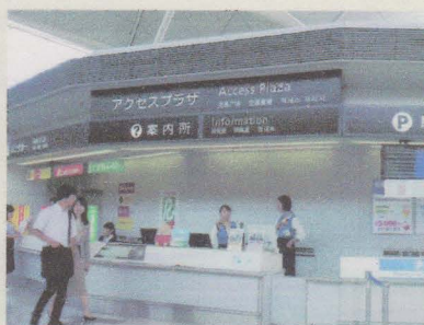
エントランス正面にアクセスプラザが