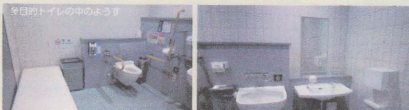
多目的トイレの中の様子